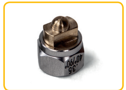
Nozzle recht meergats