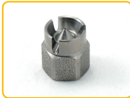
RVS nozzle met beschermkraag, recht 1-gats