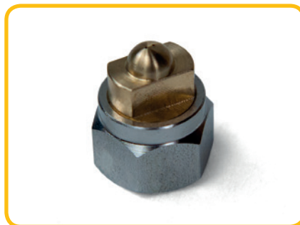
Nozzle recht 2-gats