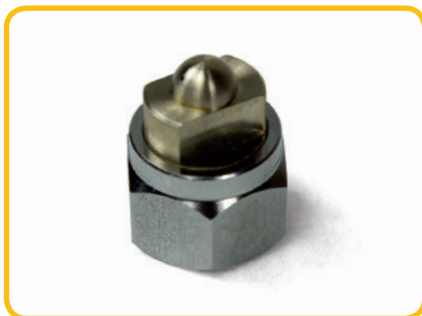
Nozzle recht 1-gats, hoek