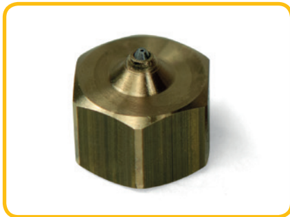
Nozzle recht 1-gats kort capillair