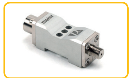
Module Meler, AOAC