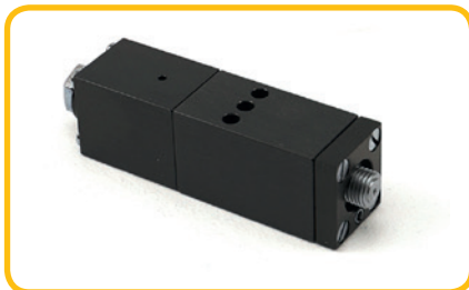
Module Robatech AX100-292, recht, compatibel