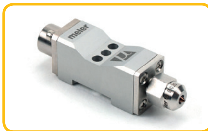
Module Meler ZC, AOAC,