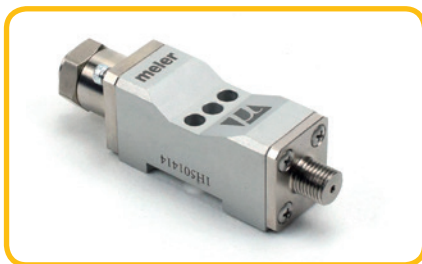
Module Meler, AOSC

Hieronder ziet u een overzicht van de standaard hotmelt modules die BIT Hotmelt Technology kan leveren.