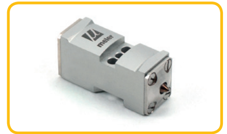
Mini module Meler ZC, vaste nozzle