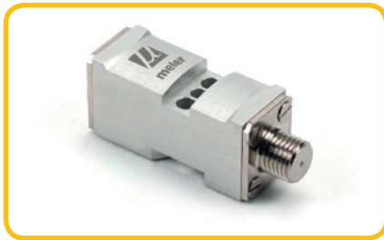
Mini module Meler

Hieronder ziet u een overzicht van de mini hotmelt modules die BIT Hotmelt Technology kan leveren.