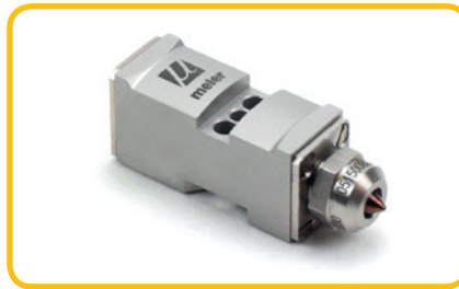
Mini module Meler ZC, demontabele nozzle