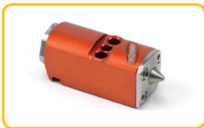
Mini module ITW Micro 10